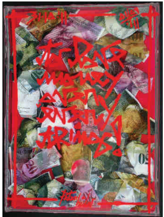
"To love money over everything!" tecnica mista e banconote su tela cm. 36 x 20 x 4