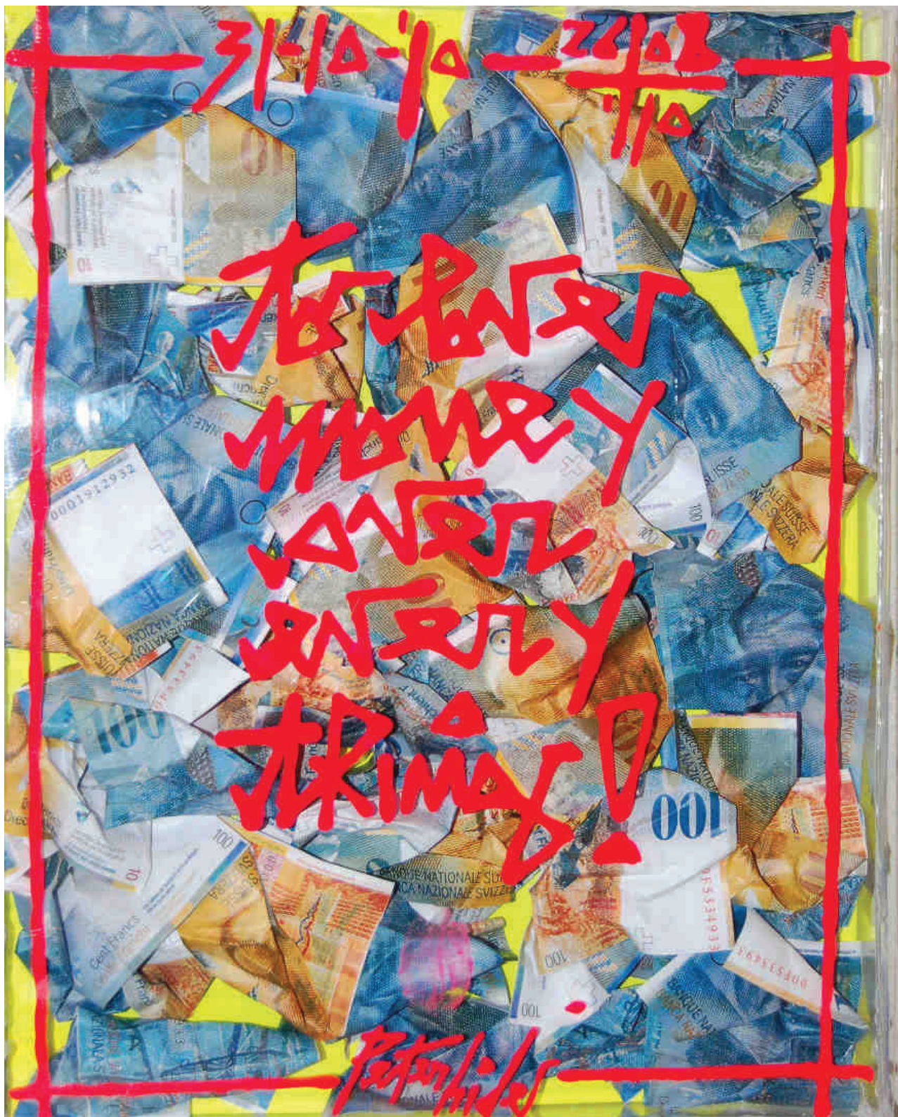
“To love money over everything!” tecnica mista e banconote su tela cm. 35 x 25 x 4

I suoi lavori sono trattati dalla galleria Orler-Artetivulab per l'Italia, da Saatchi-on line per il mercato Americano, da Infantellina Gallery-Berlino per la Germania.